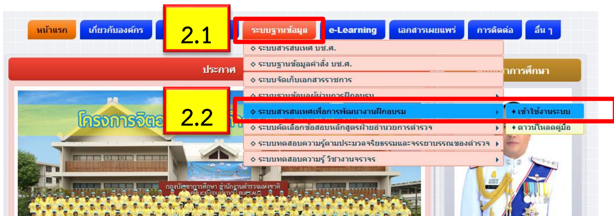
ภาพที่ 2 หน้าจอเว็บไซต์กองบัญชาการการศึกษา