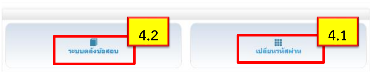
ภาพที่ 4 หน้าจอระบบสารสนเทศเพื่อการพัฒนางานฝึกอบรม