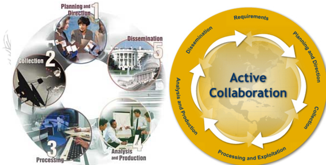
ภาพแสดงการเปรียบเทียบวงรอบข่าวกรองของ FAS และ FBI (Intelligence Cycle)

กระบวนการในการแสวงหาข้อตกลงใจในข่าวสารนั้น จะต้องผ่านขั้นตอนในการคัดกรองอย่างเป็นระบบ ซึ่งส่วนใหญ่จะมีขั้นตอนตามแผนภาพ